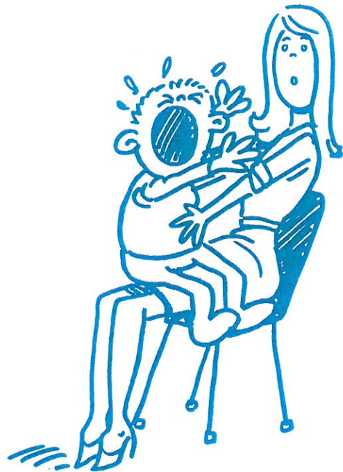
Figuur 5 Als je zelf deelneemt, is het lastiger je observaties te noteren.

Nadat je de hiervoor besproken zeven stappen hebt doorlopen, maak je een observatieplan waarin de belangrijkste zaken omtrent de observatie zijn vastgelegd. Een observatieplan maakt duidelijk wat je