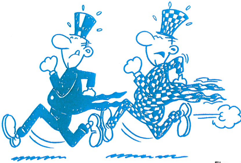
Figuur 1 Observeer je subjectief of objectief?

Verschillende factoren kunnen invloed uitoefenen op de observator. Deze factoren zijn: